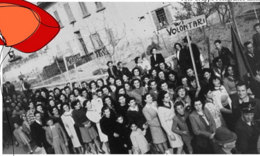
13 Febbraio 1945, partenza di 34 giovani partigiani volontari da Capraia e Limite

Deposizione in forma privata da parte del Sindaco di una corona d'alloro ai monumenti commemorativi di via Gramsci alle 11:00 e di via Corti alle 11:30